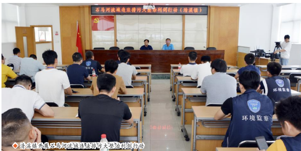
清溪镇开展司马河流域违法排污大整治“利剑行动”

【清溪讯】(夏任远 叶锦叶)9月2日,市生态环境局组织精干执法力量,分9个作战单元,3个应急小组对清溪镇开展司马河流域违法排污大整治“利剑行动”,对司马河流域流域内的重污染行业企业进行排查整治,以“零容忍”的态度,依法严查查处超标排污、不正常使用污染治理设施、偷排直排等生态环境流域违法行为,确保该区域水环境质量稳定。