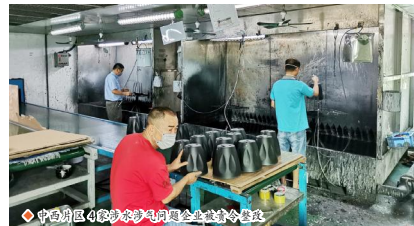
中西厂区4家涉涉气问题企业被责令整改

【清溪讯】(夏任远 叶锦叶)9月3日上午,镇“双随机”生态环境监管联合执法队再次出动,对我镇中西厂区的涉涉气企业进行突击检查。