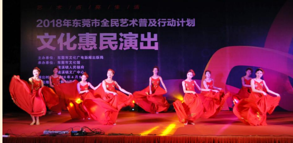
文化惠民演出,丰富市民文化生活

《清溪讯》(夏任远 叶锦叶)4月10日至11日晚,2018年东莞市全民艺术普及行动计划文化惠民演出连续走进中和村和铁松村,为村民朋友们和广大外来务工人员送去了两场精彩的文化大餐。 笔者在现场看到,两场晚会均以歌舞为主题,融入清溪非遗项目“麒麟舞”等乡土元素。《春天的邀请》以诗朗诵的形式,将盎然春日、日新月异的新清溪形象而具体地展现在观众面前;舞蹈《幸福赞