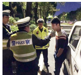
民警对驾驶员进行酒精检测

《清溪》(曾启豪 柳俊)通讯员龚宜华)为坚决遏制涉酒交通事故发生,3月8日,清溪交警大队在辖区开展涉酒驾驶违法行为专项整治行动,分别查获酒后驾驶1宗,醉酒驾驶1宗。