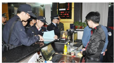
清溪公安分局清溪派出所组织开展统一清查行动

《清溪》(曾启豪 柳俊)为进一步消除辖区各类治安和消防隐患,切实维护辖区社会大局稳定,近日,清溪公安分局清溪派出所联合分局警力,组织开展统一清查行动,取得了预期成果。