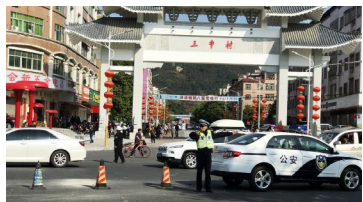
清溪交警大队积极组织警力深入大南山景区开展交通疏导

《清溪》(柳俊曾启豪)通讯员龚宜华)近期,清溪第八届赏花行活动“举办在即,为给广大游客营造平安、畅通的赏花之路,进一步做好辖区“赏花行”期间道路交通安全保障工作,3月10日至11日,清溪交警大队积极组织警力深入大南山景区开展交通疏导,为“赏花行”活动保驾护航。