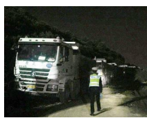
“泥头车”专项整治现场

《清溪》(柳俊曾启豪)通讯员龚宜华)近日,清溪交警大队组织警力深入辖区道路开展“泥头车”专项整治行动,严厉打击交通违法行为,预防减少涉及“泥头车”的交通事故发生。