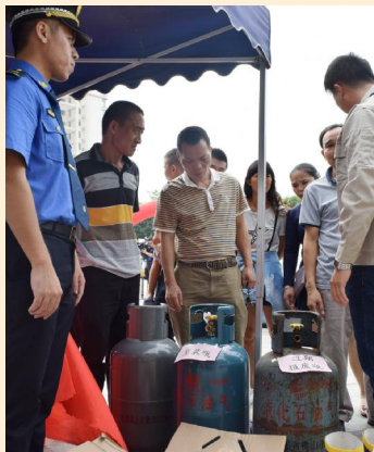
图为互动体验活动现场

《清溪讯》(杨珊 何秀蓉)11月11日,我镇举办首届“东莞·清溪城管开放日”清溪分会场活动,活动通过集体宣誓、展示设施设备等内容,进一步提升市民对城市管理工作的认识。