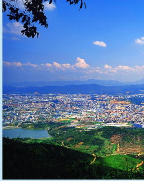
(文/何秀蓉)

清溪还积极探索基层治理新模式,新机制,将罗马村作为试点,积极创建“和谐善治示范村”,并大力推进了清溪医院新院、深圳众美与华中师大联合开办高级中学项目、农民公寓、九乡变电站、明湖变电站,800千伏清溪西北输电线路等民生项目。